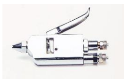
2077 Tahranpoistopistooli LECHLER